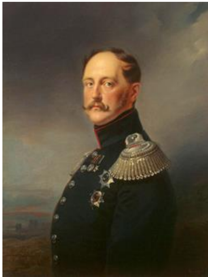
Император Николай I