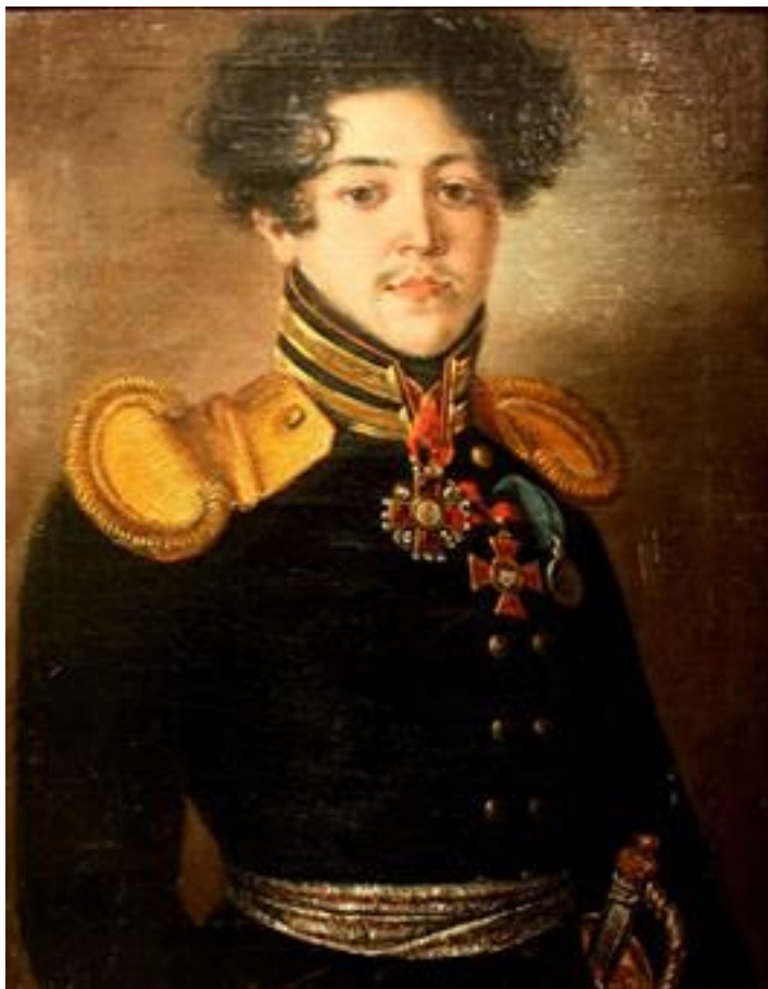
В. И. Норов

Но подлинная норовская история благодаря Интернету приобрела новое звучание, когда стали доступны книги, документы и воспоминания, ранее неизвестные.